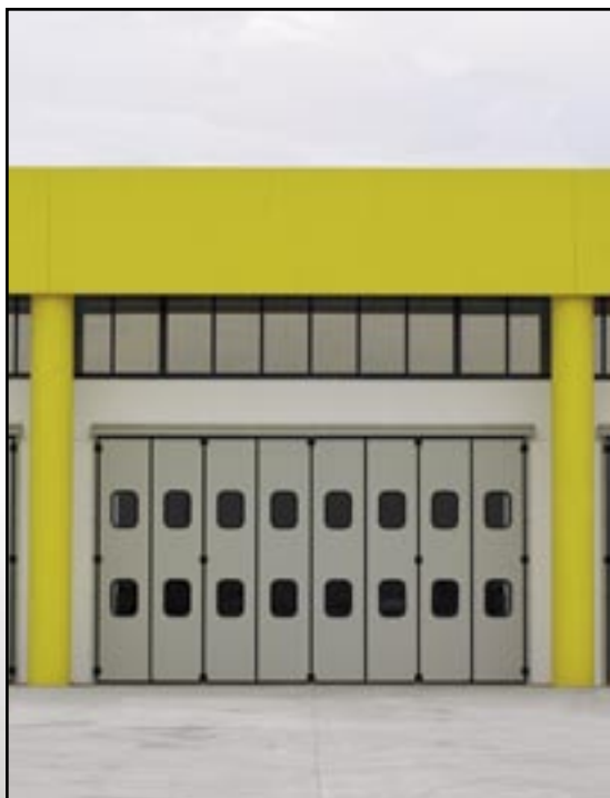
Vrata s bočním skladem s osmi sekcemi