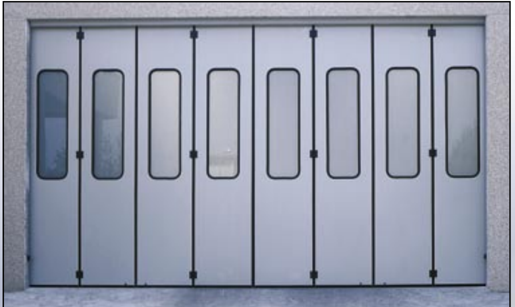
Vrata s bočním skladem s osmi sekcemi