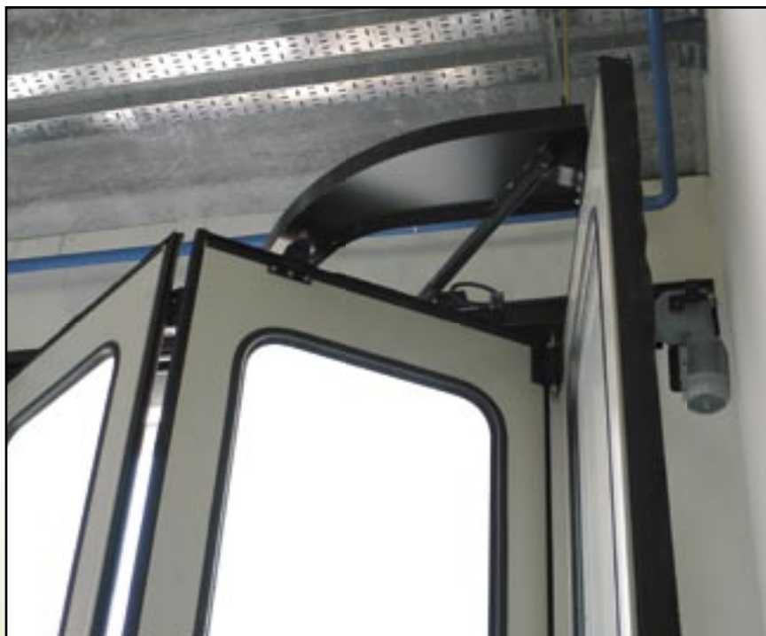
Zvláštní typ skládání vrat s lichým počtem sekcí