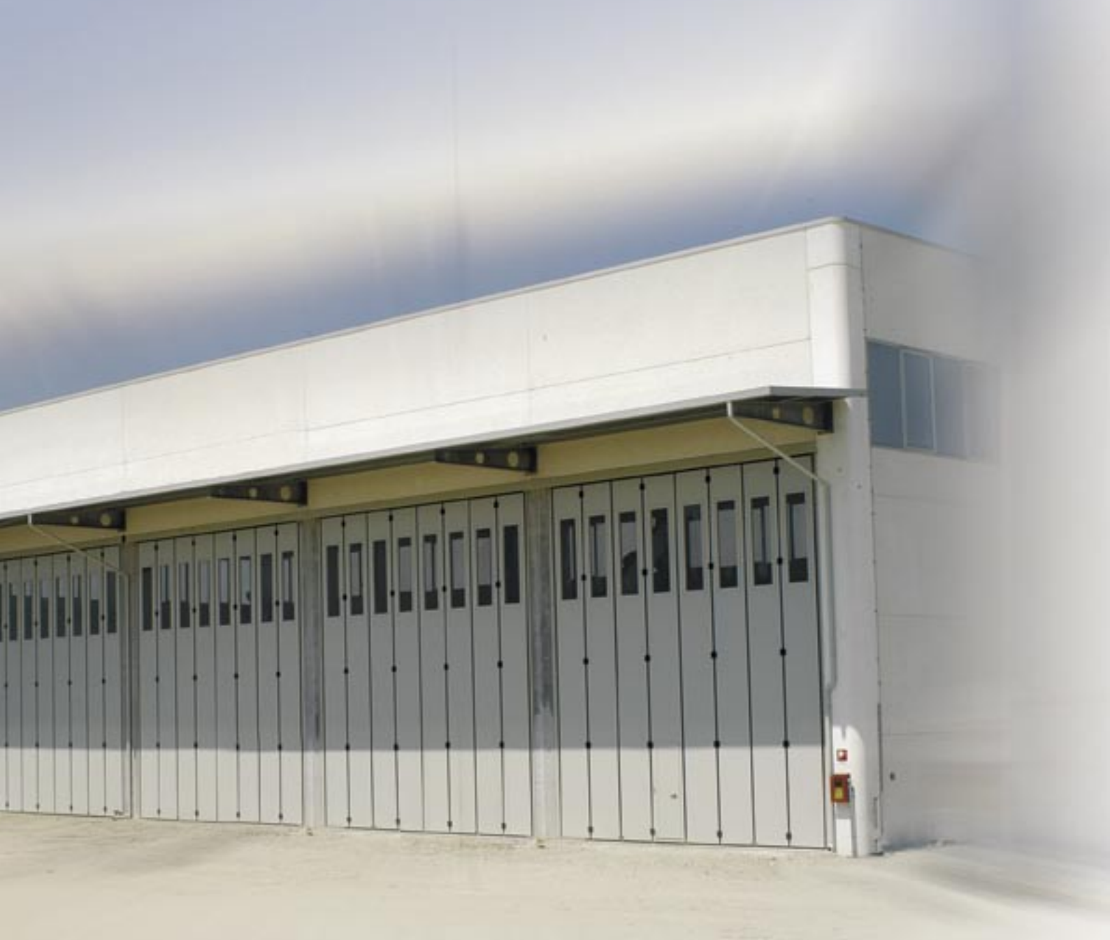
Vrata s dvojitým bočním skladem čtyři + čtyři