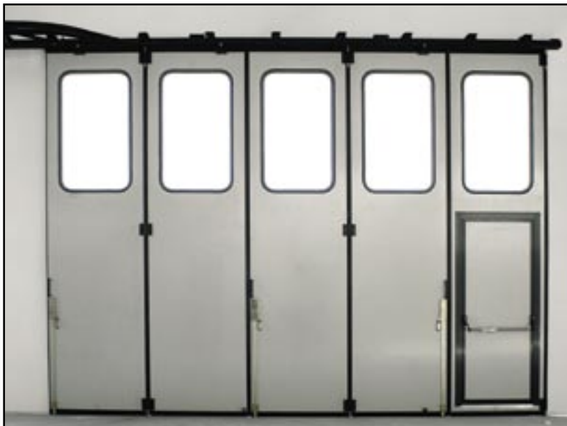
Vrata s bočním skladem s pěti sekcemi a s dveřmi