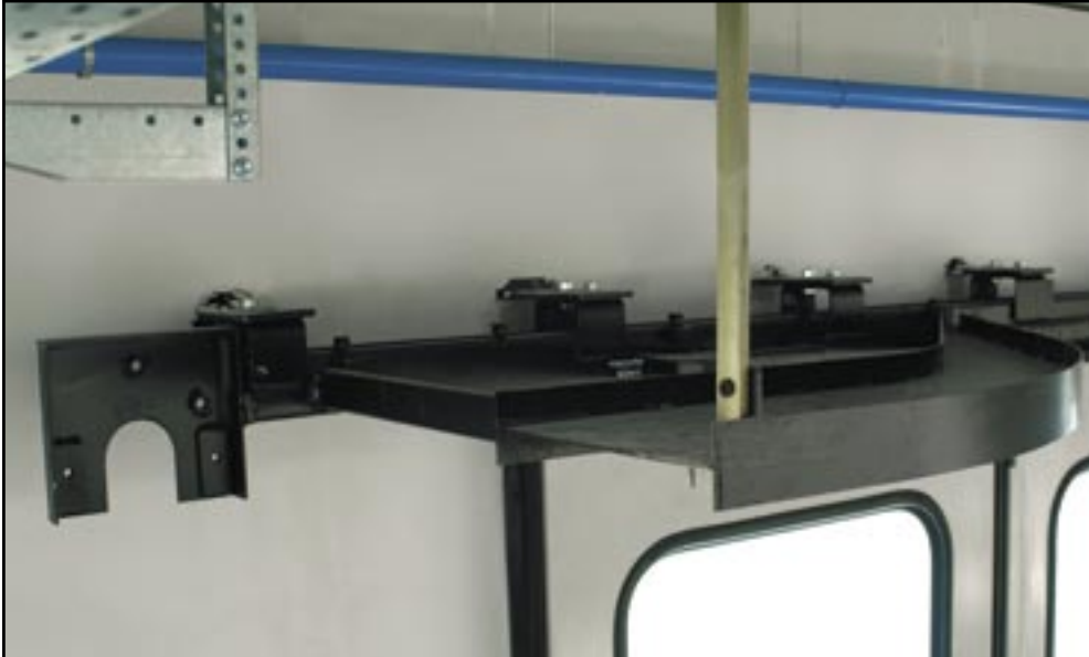
Detail vodiče připraveného pro pohon.